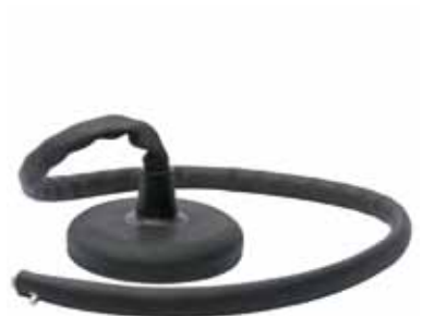
Pendelsitz für Seilbahn