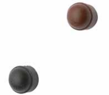
Abdeckkappe aus PE

Set zu 20 Stück. Verfügbare Farben: schwarz oder braun