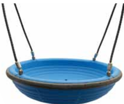
Schaukelkorb Bam Bou

Aus Polyäthylen mit Gummischutzring und Herkulesseile 20 mm. Durchmesser 120 mm