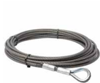
Tragseil aus Stahl