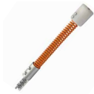
Set für Seilbahnfeder