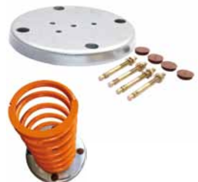
Befestigungsscheibe mit Schrauben für Wippsgeräte